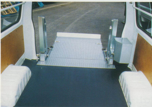
床張架装はオプション