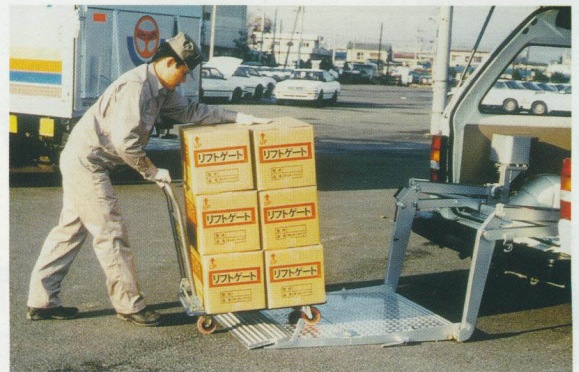
足踏み式キャストレストッパー

★幅の広いワンボックスカーに幅広タイプ製作可能です プレートの長さも特注で替える事ができます