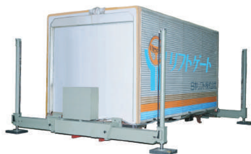
アウトリガ引出し状態