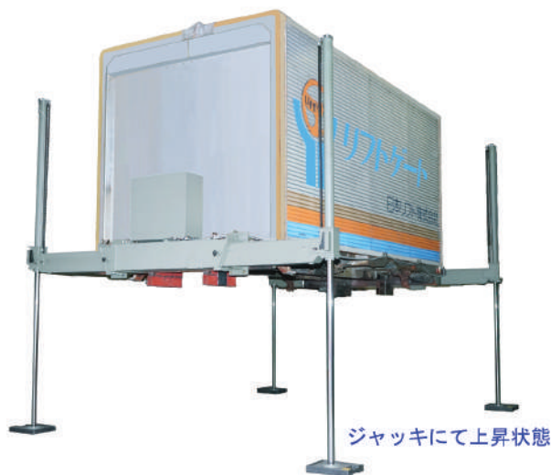
ジャッキにて上昇状態

平ボディトラックにて運搬できるので、車両の維持費が発生しません。複数の展示コンテナ・災害支援コンテナを準備することが可能です。