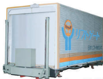
アウトリガ収納状態