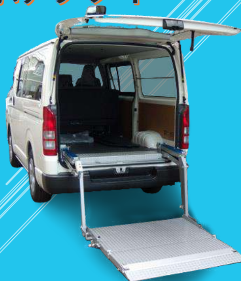
キャストーストッパー装備で安全に荷役作業。