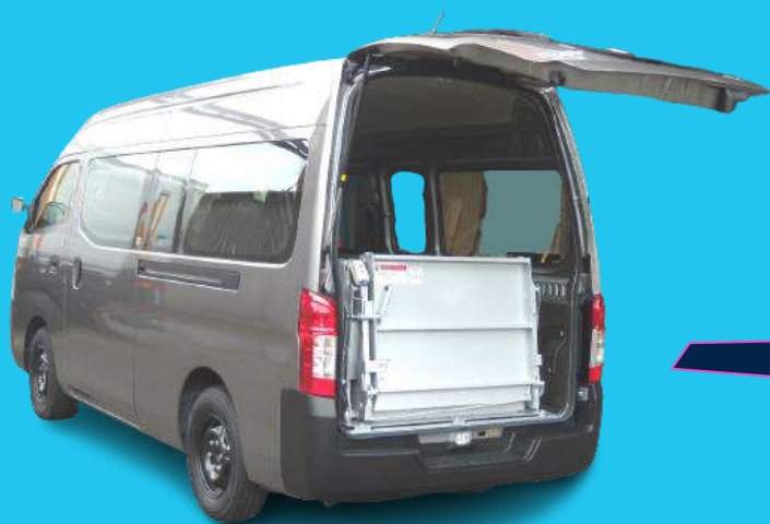
様々なミニバンに対応するリフトです。