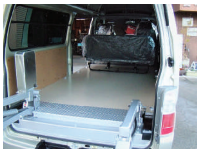
ロンマット床材張り