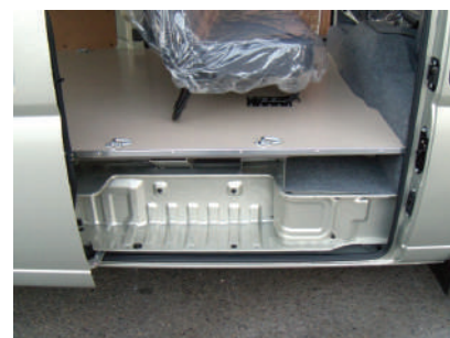
床面ロープフック