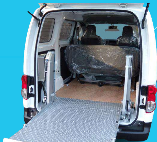
コンパクトで、車内を広々と確保。