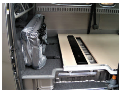
セカンドシート仕様