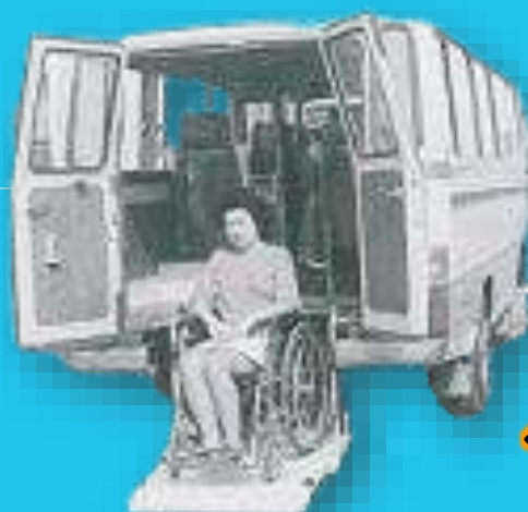
創業当時のチェアリフト