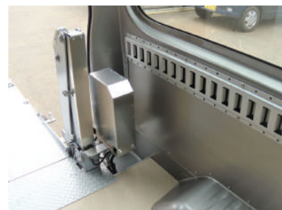
ラッシングレール