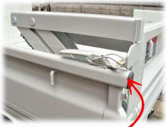
以前のエビロックの向き

この度エビロックの箇所を、より幅広い車種に対応するように改良いたしました。以前はあおりの上にそのまま乗せていたエビロックを、横方向に固定することによってはみ出しを防ぎました。はみ出しを防ぐことにより車検など法規を通過するメリットや、事故防止にも繋がります。