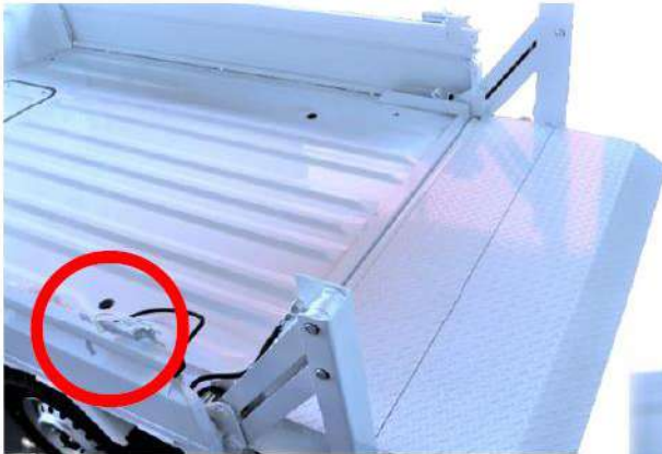
KLW 型・軽自動車向け リフトゲート