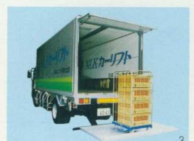
リフト使用中は上のドアは閉まりません