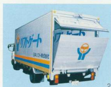
プレートを開くと自動的に上のドアが開きます