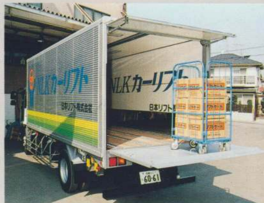
キックドア(オプション)プレートが開くと自動的に上のドアが開き、荷役作業中は保持する。