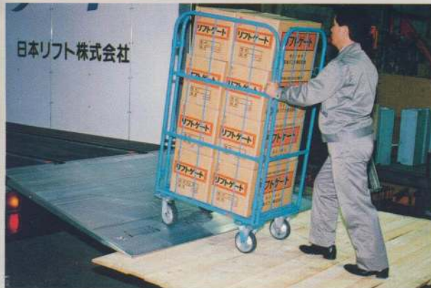
上下首振り傾斜によりプラットホームで渡し板として荷役作業ができる。