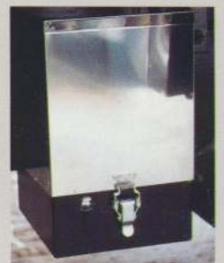
低騒音BOXユニット 振動吸収リングと吸収材の適用により低騒音を実現。ステンレスカバーにより防蝕・防雨対策も万全。