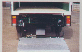
自動テイルト機構

プレートは、接地すると先端が自動的にテイルト運動を行う為、台車、箱物等の荷役が容易に行えます。