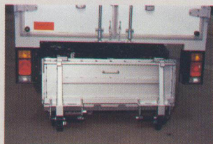
プレートが自動的に立ち上がります。